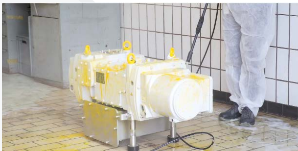
DRYVAC DV 650 FP-r は、洗浄環境用に設計

ドライ圧縮式の堅牢な真空ポンプDRYVAC DV 650をご覧ください。10リットルの水に対応した堅牢性テストをご紹介します。