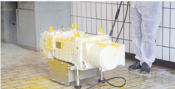
세척 환경용 설계의 DRYVAC DV 650 FP-r

건식 압축 방식의 견고한 진공 펌프 DRYVAC DV 650 을 살펴보십시오. 10리터의 물을 통과시키면서 견고성 테스트를 실시합니다.